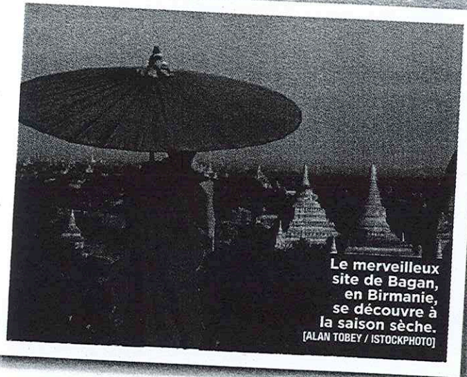
Le merveilleux site de Bagan, en Birmanie, se découvre à la saison sèche.

► Quel spa ? Le spa éco-responsable du Singular développe un protocole de soins à partir de plantes et de fruits issus de l'agriculture biologique locale.