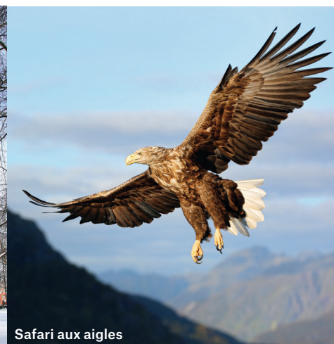
Safari aux aigles