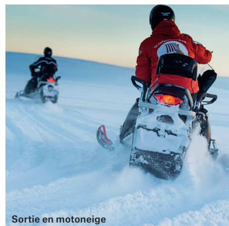
Sortie en motoneige